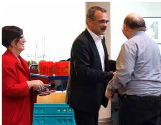
Fête du CFC 2016 • Remise des diplômes

Jean-François Steiert, conseiller national, président