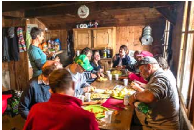
Cours d'un jour "Une journée à l'alpage" 2016

Lors de la mise en place de la nouvelle saison, un autre constat nous a un peu interpellés : sur 11 cours annulés pour cause de manque d'inscriptions, 7 étaient des nouveautés ! Passé un très bref moment de déception, nous avons eu la chance de pouvoir échanger sur ce point